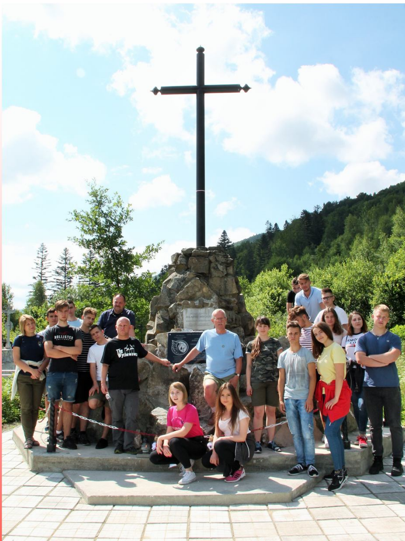
Cmentarz Legionowy - Pasieczna