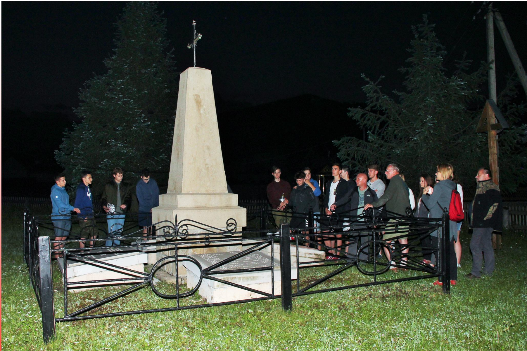
Cmentarz Legionowy - Rafajłowa