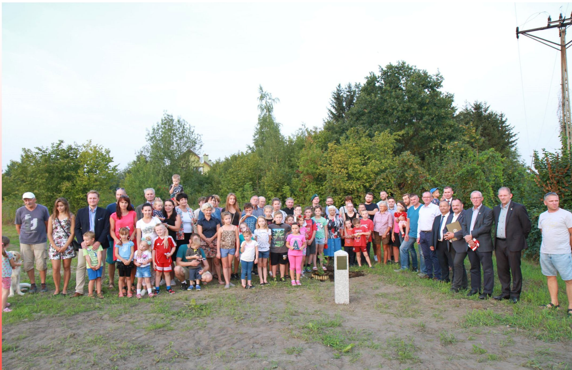
Dąb Michała Osmoli - skwer przy ul. Witosana os. Wojśław 3 września 2018 r.