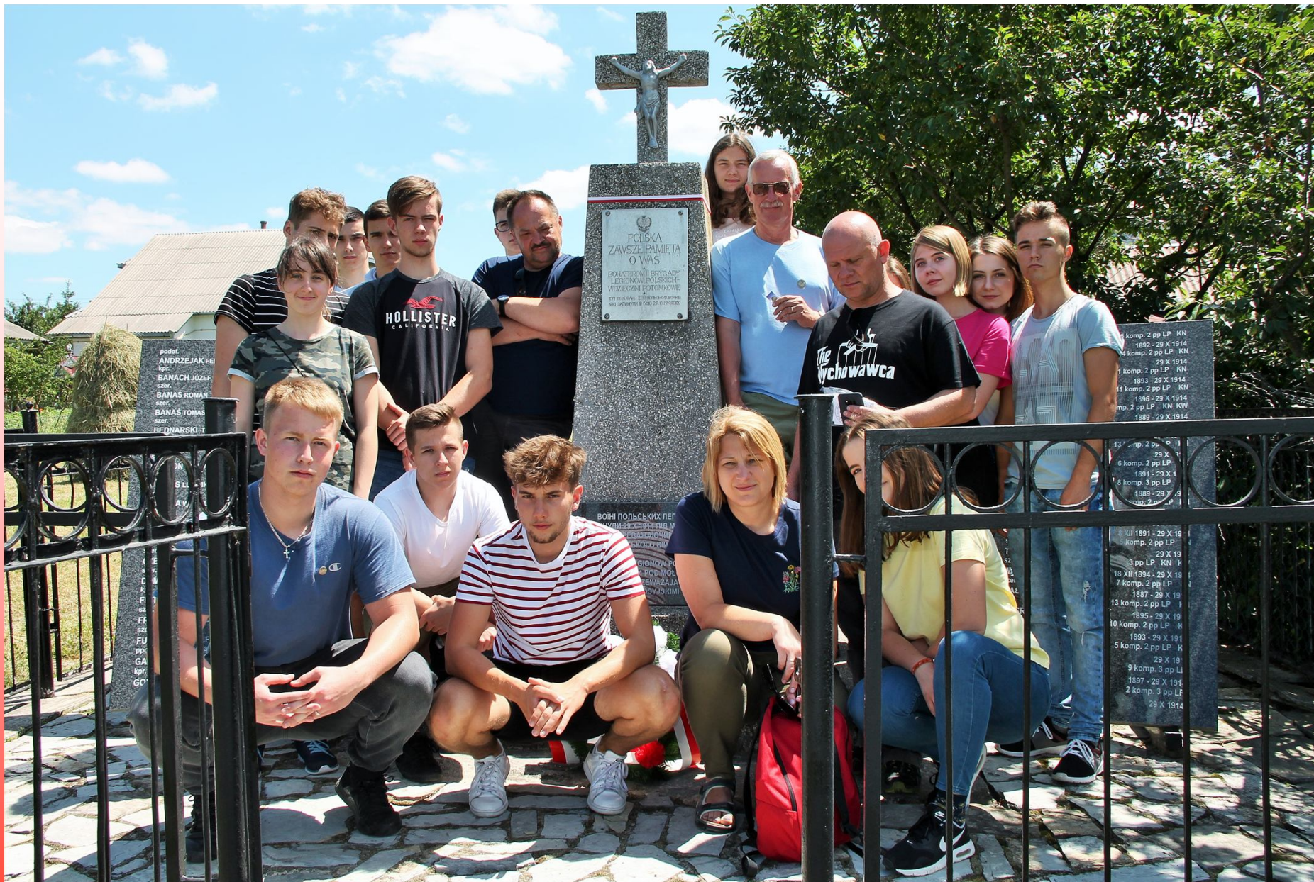
Cmentarz Legionowy - Mołotków