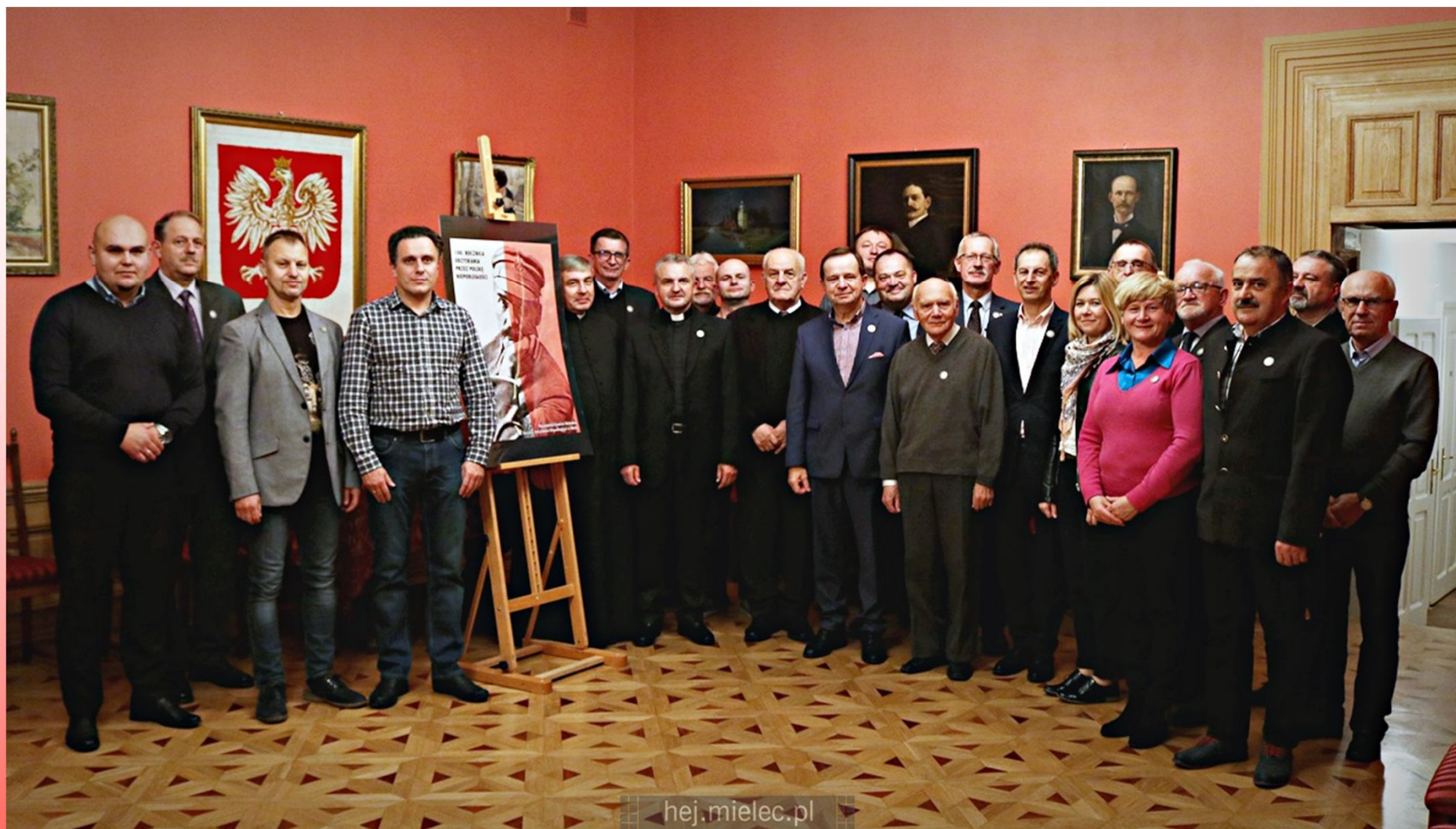
Inauguracyjne spotkanie Obywatelskiego Komitetu Obchodów Setnej Roczniczy Odzyskania Niepodległości w Mielcu 4 listopada 2017 r.