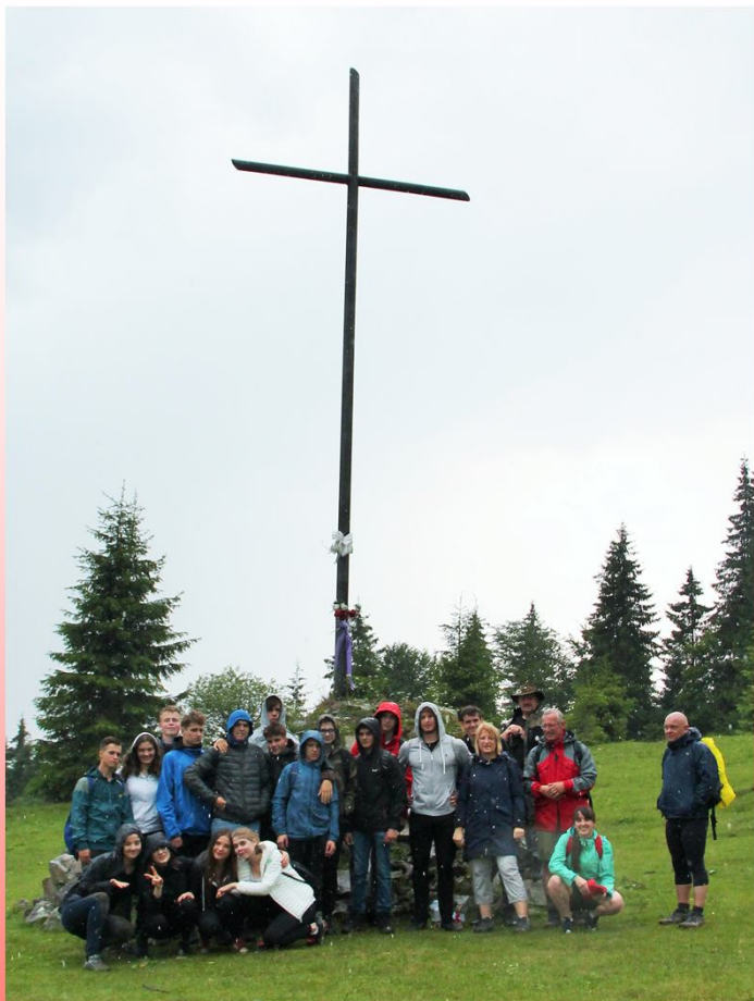
Przełęcz Rogodze Wielkie - Legionów

"Młodzieży polska, patrz na ten krzyż! Legjony polskie dźwignęły go wzwyż, Przechodząc góry, lasy i wały Do Ciebie Polsko, i dla twojej chwały."