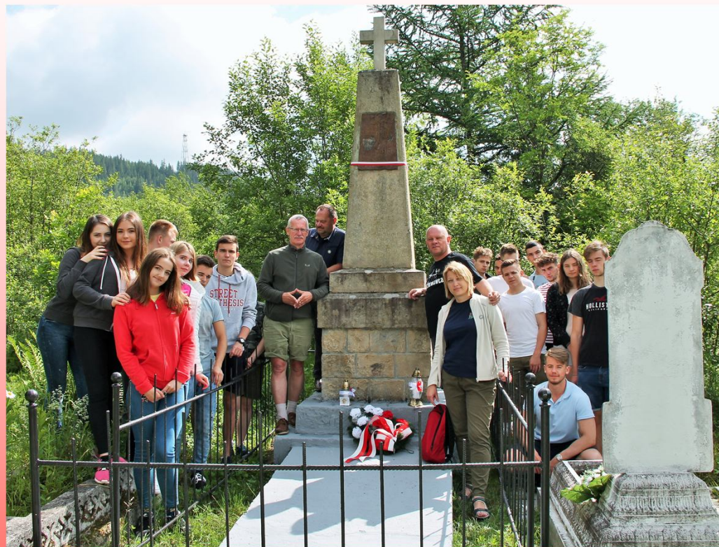
Cmentarz Legionowy - Zielona