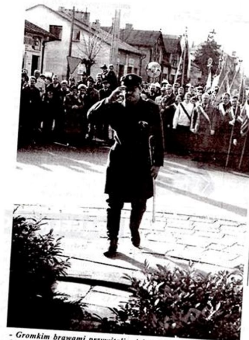
- Gromkim brawami przywitani mieleczanie Marszałka Piłsudskiego. O tegorocznych obchodach Święta Niepodległości w Mielcu piszemy na stronie 4.