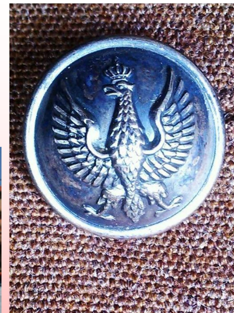
Replika guzika legionowego

Niewielka odznaka mocowana do ubrania na pin. Przeznaczona jako pamiątka dla uczestników uroczystości.